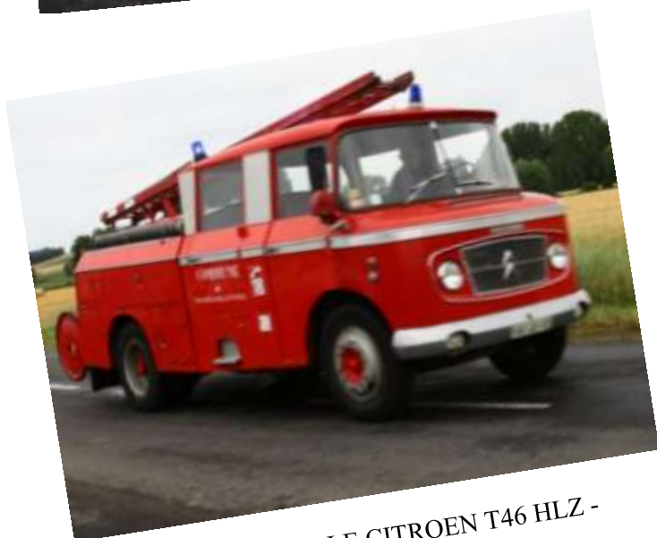
FPT DROUVILLE CITROEN T46 HLZ - 1965