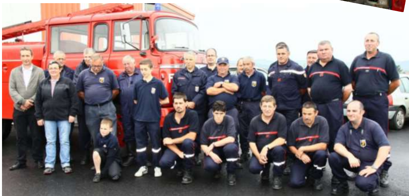
La dernière photo de famille