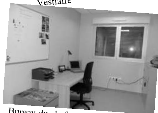
Bureau du chef

Profitons de ces pages pour remercier ces Pompiers volontaires qui veillent sur notre sécurité et qui viennent à notre secours lorsque nous en avons la besoin.