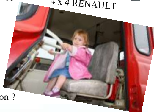
Nouvelle vocation ?